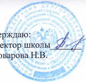
График выдачи продуктовых наборов обучающимся, находящимся на дистанционном обучении на 2023-2024 учебный год